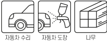
자동차 수리 자동차 도장 나무